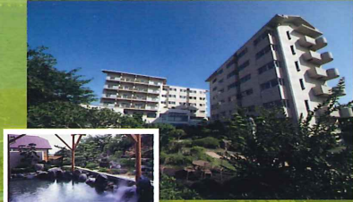
【2泊目】天草松島観光ホテル岬亭