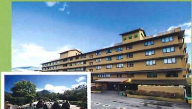
【1泊目】ゆふいん山水館