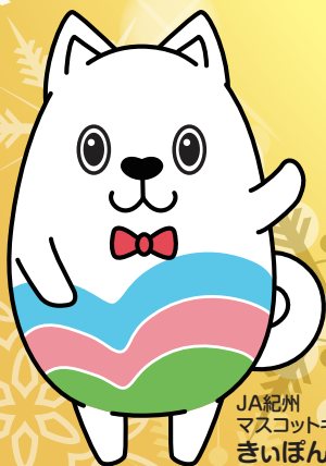
JA紀州 マスコットキャラクター きいぼん