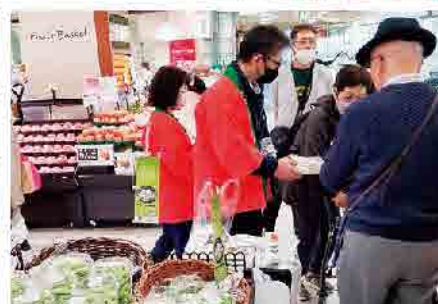
コープこうべシーヤ店ではウスイエンドウを使用した豆ごはんの試食販売も行いました！