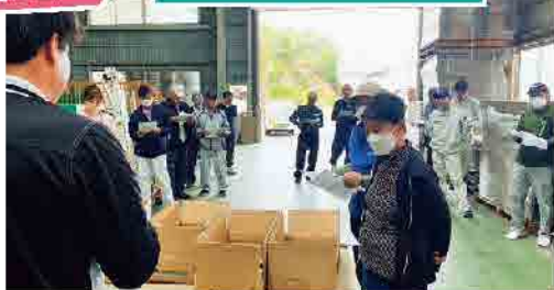
露地うすいについて