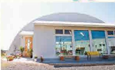
たまごをイメージした外観

京奈和自動車道の高野口ICすぐの少し高い場所にある「たまご絵本館」は、令和4年4月にオープンしました。約1,500冊のさまざま