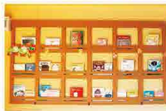
たまごに関する絵本コーナー

ています。夏はひんやり。冬はあったか。仕切りが無い開放感溢れる空間と大きな窓から差し込む光がとても心地良いです。