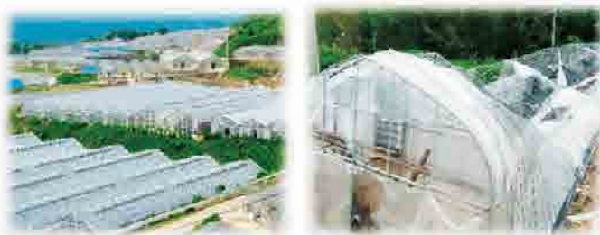
※自然消耗による損害は対象となりません