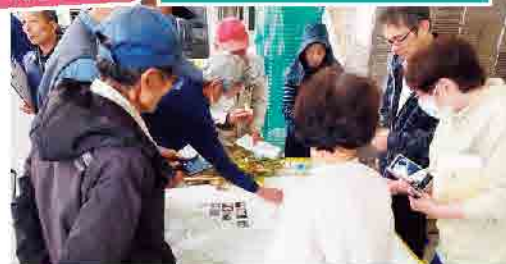
ニンニクについて