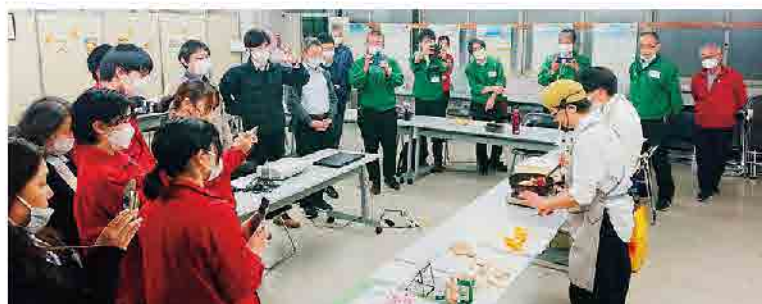
▲はっさくレシピを実演している様子